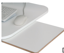
A4-skiva inkl beslag DTB042