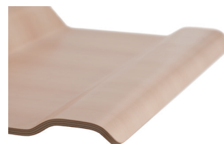
Skiva med handlovsstöd finns för en skärm

Elektrisk datorarm med handlovsstöd för en skärm, bredd 650 mm DTA125161