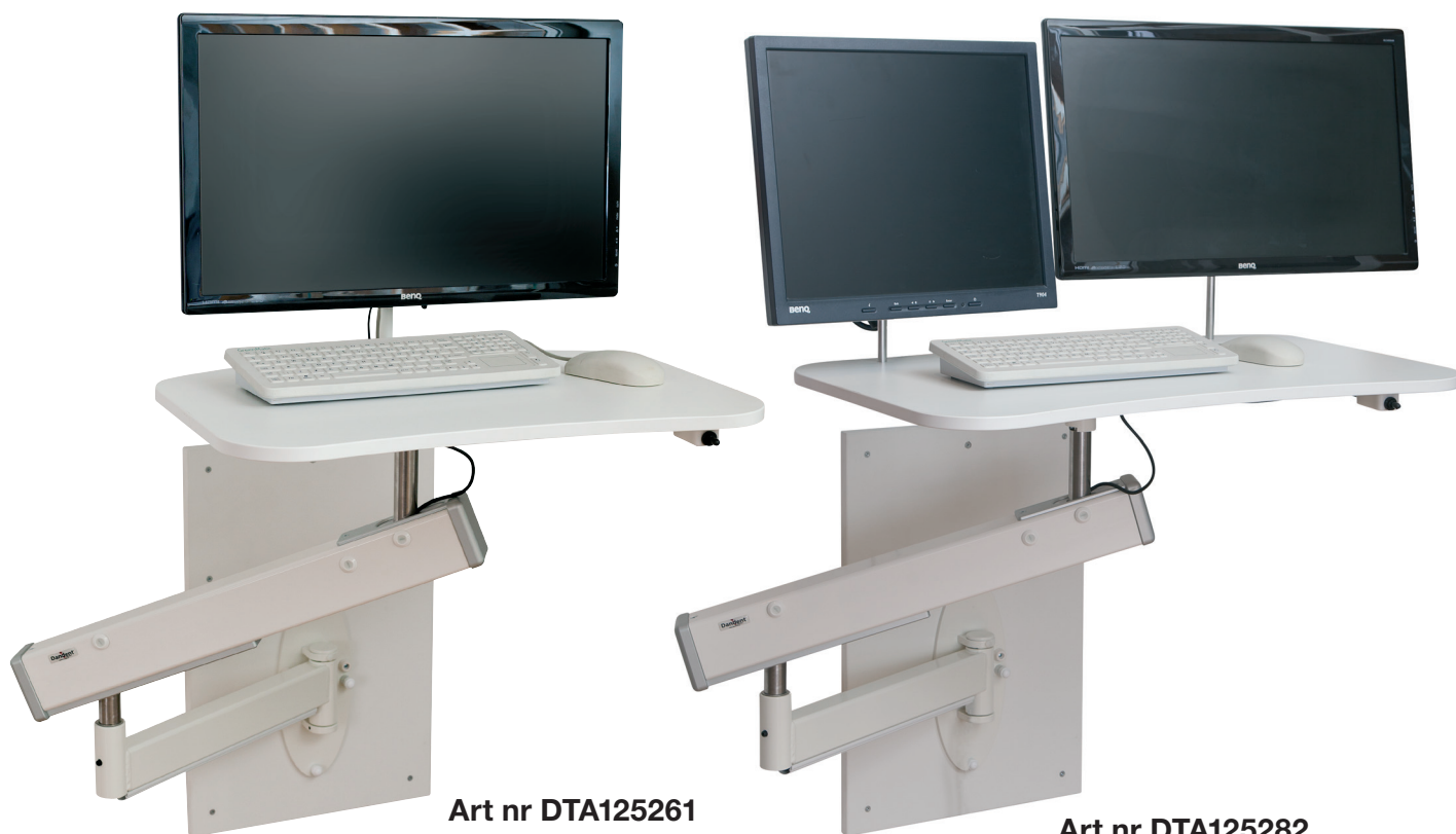
Art nr DTA125261