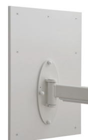
Förstärkningsplatta /väggfäste DTB010V