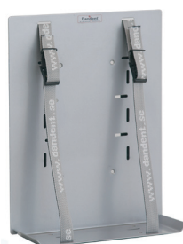
Datorkonsol för montage på vägg eller under skrivbordsskiva DTB070