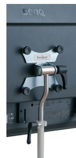
Skärmhållare med Vesafäste montageskruvar ingår